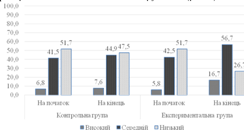
Рис. 3. Динаміка діяльнісного критерію соціокультурної компетентності майбутніх судноводіїв міжнародних рейсів

За цим критерієм також наявні позитивні зрушення (рис. 3):