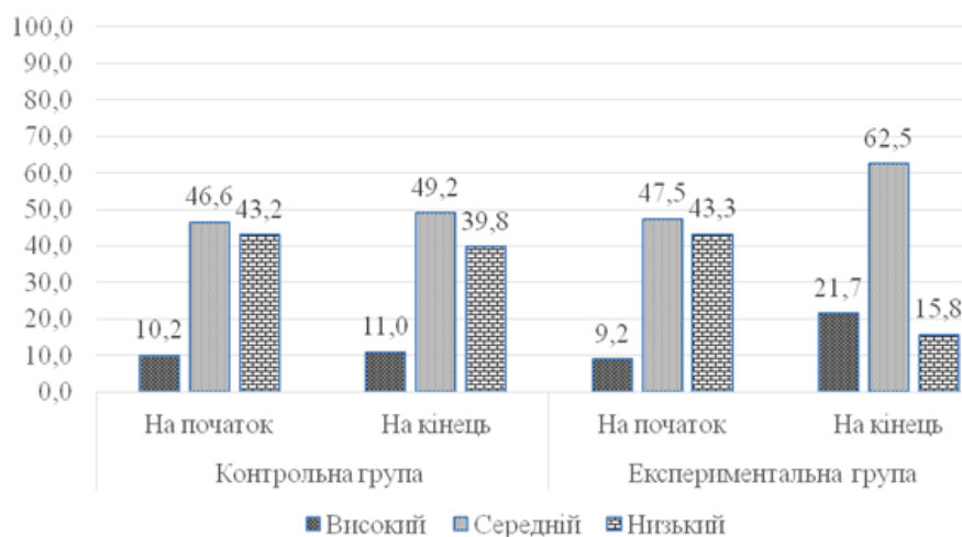
Рис. 1. Динаміка мотиваційного критерію соціокультурної компетентності майбутніх судноводіїв міжнародних рейсів

Узагальнені результати вимірювань рівня сформованості соціокультурної компетентності майбутніх судноводіїв міжнародних рейсів за мотиваційним критерієм представлено на рис. 1.